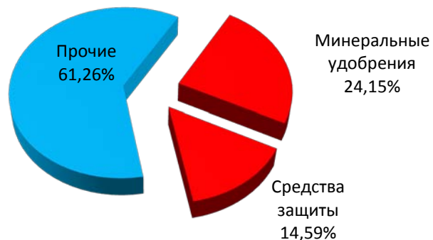
Без Биоплант Флора